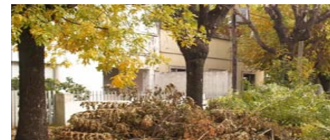
Ganchos de árboles