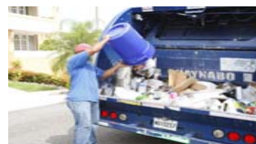
Recogido de reciclaje casa por casa

El Municipio de Guaynabo cuenta con la Ordenanza Municipal #37 que hace compulsorio el reciclaje en nuestro municipio. El Municipio brinda un servicio de recogida de reciclaje casa por casa. Los residentes cuentan con un recipiente de 20 galones para el depósito de los materiales reciclables. Se utiliza el sistema single stream (mezclado), todos los materiales juntos en un solo recipiente. Para facilitarle la disposición de los mismos a los residentes.